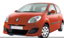
Renault Twingo, Authentique 1.2, 60 eco2, 43 kW Kaufpreis (Euro): 9 890