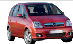
Opel Meriva, 1.8 Edition, 92 kW Kaufpreis (Euro): 11 000 Anzahlung (Euro): 2 200