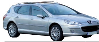
Peugeot 407, SW 1.8 Kombi Tendence 125, 92 kW Kaufpreis (Euro): 14 000 Anzahlung (Euro): 2 800