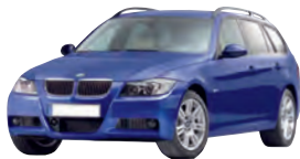
BMW 3er, 320d Touring, 120 kW Kaufpreis (Euro): 18 000 Anzahlung (Euro): 3 600