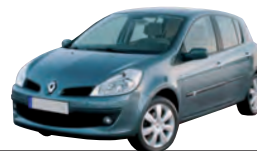
Renault Clio, 1.2 Campus, 3-t., 55 kW Kaufpreis (Euro): 6 500 Anzahlung (Euro): 1 300