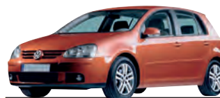
VW Golf V, 1K 1.9 TDI Trendline, 77 kW Kaufpreis (Euro): 14 000 Anzahlung (Euro): 2 800