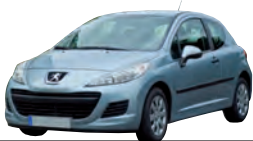
Peugeot 207, Limousine Urban Move 95 5-t, 70 kW Kaufpreis (Euro): 16 300