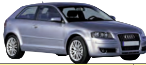
Audi A3, 1.9 TDI Ambiente, 77 kW Kaufpreis (Euro): 15 500 Anzahlung (Euro): 3 100