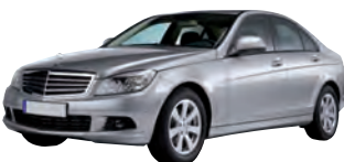
Mercedes C 180 Kompressor, 115 kW Kaufpreis (Euro): 19 700 Anzahlung (Euro): 3 940