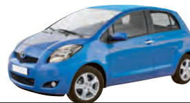
Toyota Yaris, 1.0, 3-t., 51 kW Kaufpreis (Euro): 7 000 Anzahlung (Euro): 1 400