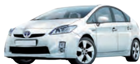
Toyota Prius Hybrid, 1.8 XW3 (A), 73 kW Kaufpreis (Euro): 25 750