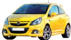
Opel Corsa, Edition 111 J., 51 kW Kaufpreis (Euro): 14 050