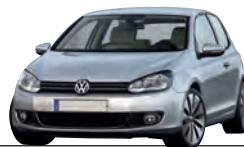
VW Golf VI, 1K 1.6 I TDI, 77 kW Kaufpreis (Euro): 20 825