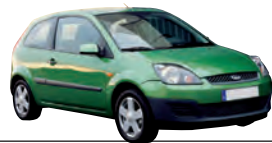
Ford Fiesta, 1.4 Ambiente, 59 kW Kaufpreis (Euro): 7 000 Anzahlung (Euro): 1 400