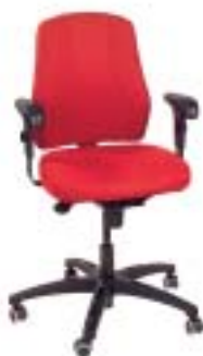
Ikea/Verksam 226 Euro