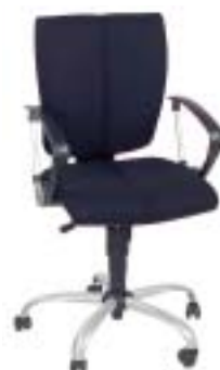
Nowy Styl Cinque 179 Euro

aber der Bezug ist wenig strapazierfähig. Größtes Manko: Die Armlehnen sind wenig belastbar.