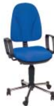
Topstar Ergo Steel 69 Euro

Unbequem: Stuhl mit einigen Verstellmöglichkeiten, aber nur mäßigem Sitzkomfort. Besonders Synchronmechanik und Rückenlehnenpolster sind ergonomisch ungünstig. Zusammenbau etwas mühsam, Klemmstelle an der Verstellmechanik unter dem Sitz.