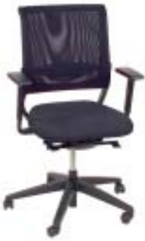
Sedus 510 Euro