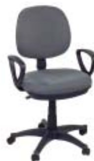
Drehstuhl H 305-3 59 Euro

Kippelig: Stuhl mit nur mäßigem Sitzkomfort und festen, zu niedrigen Armlehnen. Ist haltbar, aber die Verstellteile sind unhandlich und schwergängig. Vorsicht, nicht standsicher: Stuhl kann unter Belastung nach hinten wegkippen.