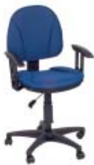
Höffner 49 Euro