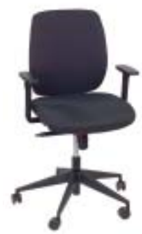
Rovo Chair 375 Euro

viel Bewegungsfreiheit, für kleine Nutzer ist die Sitzfläche aber zu tief. Ist sicher und haltbar und hat einen sehr guten Bezug.