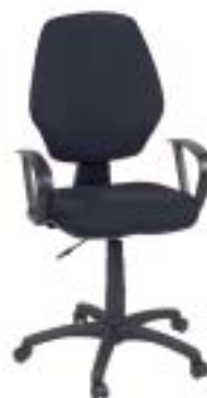
Nowy Styl Master 99 Euro

Viele Schwächen: Preisgünstiger Stuhl mit nur mäßigem Sitzkomfort. Sehr weich und wenig haltbar gepolstert, Winkel zwischen Sitzfläche und Rückenlehne ergonomisch ungünstig. Etwas mühsam zusammenzubauen, Armlehnen wenig belastbar und verbiegen sich schnell.