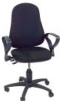
Topstar Point 60 109 Euro

Wollbezug. Schnell zusammengebaut, haltbar und standsicher. Aber Sicherheitsmanko: Gasfederhalterung teilweise scharfkantig.