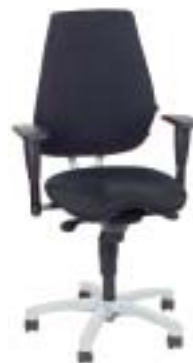
Topstar Alustar Basic , 249 Euro

Bezug ist wenig haltbar und die Halterung der Gasfeder hat scharfe Kanten.